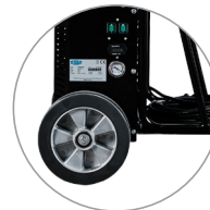
Nicht abfärbende, baustellenaugliche 10-Zoll Räder

Der VCE2400D wurde speziell für das Schleifen von Fußböden entwickelt, eignet sich jedoch ebenso hervorragend für andere Anwendungen, bei denen eine leistungsstarke Staubabsaugung erforderlich ist. Mit einer Leistung von 2,4 kW erfüllt er anspruchsvolle Projektanforderungen zuverlässig. Das Modell ist