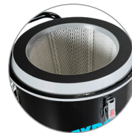
H13 HEPA-Filter sorgt für 99,95 % Partikelfilterung ( \geq 0,3 \mu\text{m} ), für saubere und sichere Luft